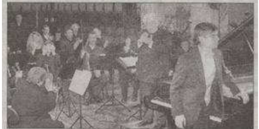
Le concert fut un véritable succès.