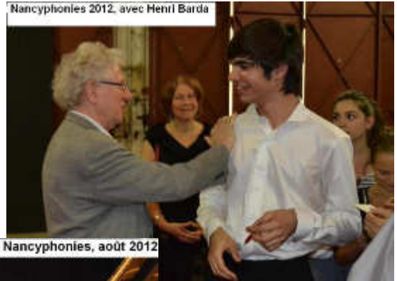
Au Festival des Nancyphonies, août 2012