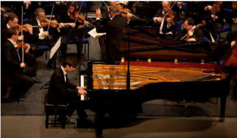
Concours International de piano à Hastings, Angleterre, remise du 3e Prix par Petula Clark, marraine du concours