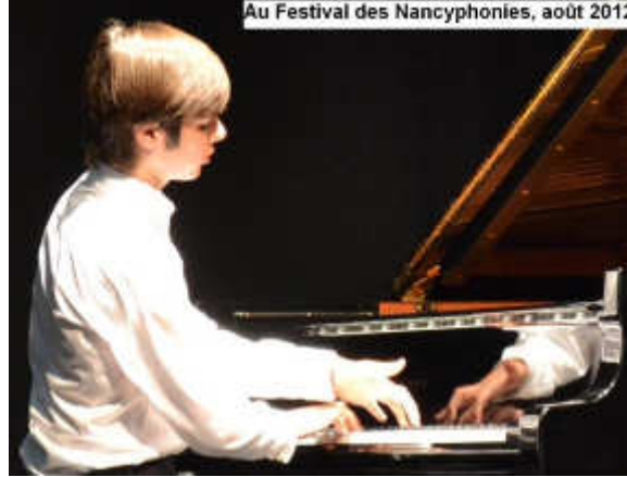
Au Festival des Nancyphonies, août 2012