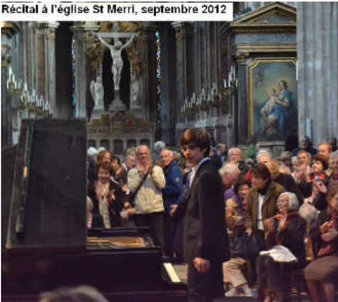
Récital à l'église St Merri, septembre 2012