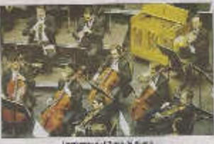
Le festival de l'Europe poétique et musicale.

La 50 e édition du Festival International de l'Europe poétique et musicale va buter non point dans la 20 e avril et le 12 mai.